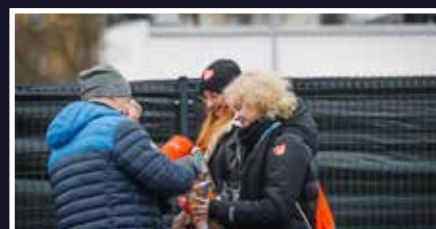
32. finał WOŚP - s. 13