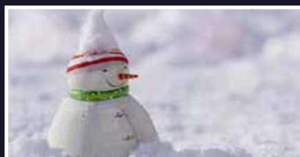
Ferie 2024! - s.15