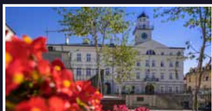
Budżet na rok 2024 uchwalony - s.4